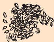
Brytyjskie brązowe siemię lniane