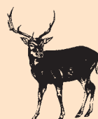
Dziczyna czarna i płowa